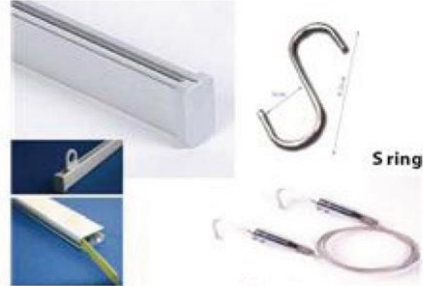
족자봉 및 S자고리