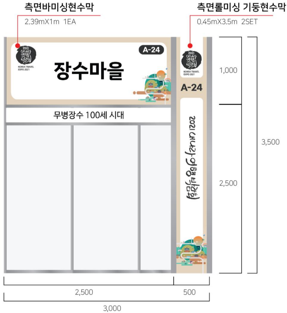
▲ Side View