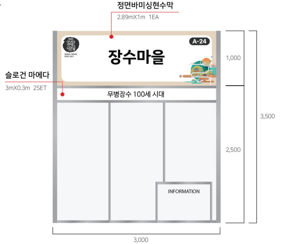
▲ Front View